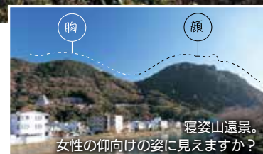
寝姿山遠景。女性の仰向けの姿に見えますか？