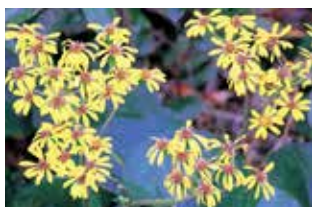
足元を彩るツツブキの花。