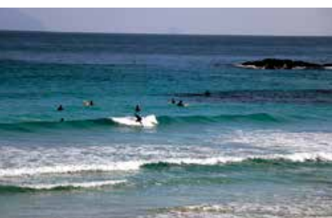
700mの美しい砂浜が続く、白浜大浜海岸。秋もサーファーが足を運ぶ。