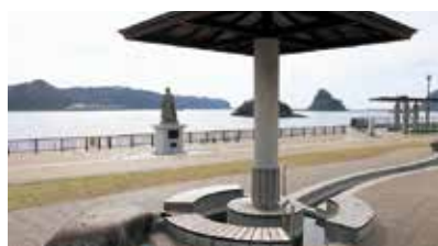
まどが浜海遊公園にある、海遊の足湯。海を見ながらリラックス。

まずは下田ロープウェイ寝姿山山麓駅から山頂駅へ向かい、寝姿山自然公園の遊歩道を散策しよう。四季折々の花が植えられており、目を楽しませてくれる。展望台から下田港を眺め、縁結びのパワースポット・愛染明王堂 あいぜんみょうおうどう などを見学したら、公園の奥から延びる林道に入り、ウォーキングを始めよう。