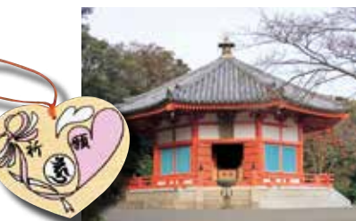
縁結びのパワースポット、愛染明王堂。ハート型の絵馬が人気。