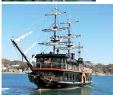
遊覧船・黒船「サスケハナ」。約20分で下田港内を1周する。