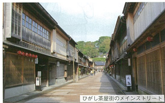
ひがし茶屋街のメインストリート

藩祖前田利家公を祀る神社。神門は、和洋中の三様式が取り入れられ、最上層にはステンドグラスがはめ込まれている。屋根には日本初の避雷針も。