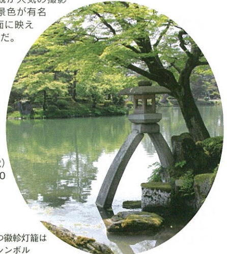
二脚で立つ徽軫灯籠は兼六園のシンボル

開園 7:00～18:00 (3/1～10/15)、 8:00～17:00 (10/16～2/末) 休園 無休 入園料 大人 300円 (65歳以上は無料)、 小人 100円(6～17歳) 電話 076-234-3800