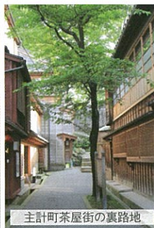
主計町茶屋街の裏路地